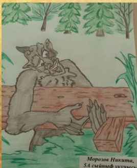
Морозов Никита, 5А сыйныф укучысы