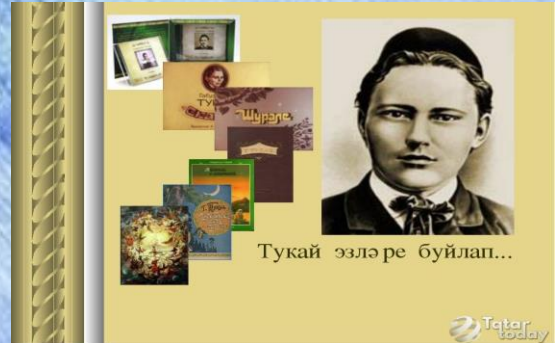
Тукай эзләре буйлап...